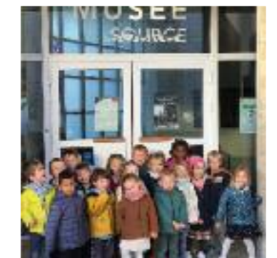
Visite de l'exposition, l'atelier de Sergio de Castro au musée de Saint Lô

La rentrée du 1er septembre s'est bien déroulée avec 233 élèves, 80 en maternelle et 153 en élémentaire. Les élèves sont répartis dans 11 classes. 4 agents territoriaux spécialisés des écoles maternelles accompagnent les enfants des 4 classes de maternelle. De nombreux projets sont mis en œuvre au fil de l'année, liste non exhaustive :