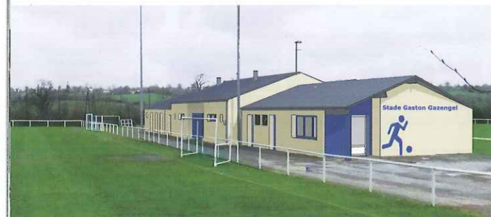
Cabinet Eve Richard Thion

Les vestiaires actuels du stade Gaston Gazengel ont été construits en 1994. L'ensemble est en bon état mais ne répond plus aux nouveaux besoins du club qui a évolué de manière significative ces dernières